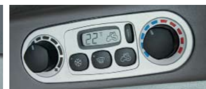
▲▼ El climatizador automático es opcional. Tiene un elevado número de salidas de aire. El cuadro es digital.