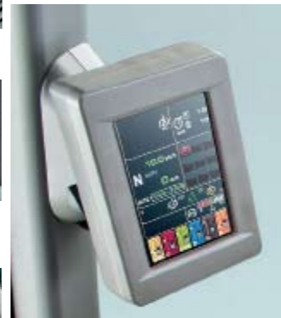
▲▲ Los mandos de las luces se agrupan en un solo mando. El interior del tractor está repleto de huecos portaobjetos. Una pantalla a color muestra toda la información.