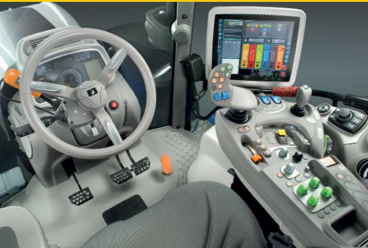
▲▼ La cabina es como un avión. Los mandos están agrupados por funciones e identificados por colores. El joystick es un mando clave y debajo el ASM activa o desactiva la tracción integral o los diferenciales según velocidad y giro de las ruedas.