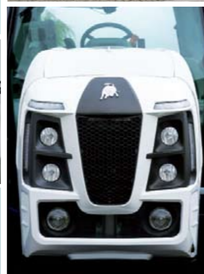
▲▲ El diseño es espectacular. Puede llevar xenón o LED. Y además de los de carretera, cuenta con 9 faros de trabajo traseros y 8 delanteros. Cada rueda cuesta 4.000 euros.