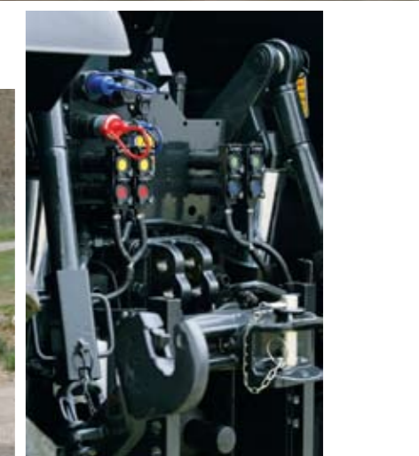
▲ El sistema hidráulico prevé hasta 7 distribuidores auxiliares que se controlan con prácticos pulsadores.

Mach 250 T4i VRT es el cambio automático CVT de origen ZF, una transmisión variable continua que mientras adaptada en un turismo nunca nos ha terminado de convencer del todo, lo cierto es que en el tractor ofrece un mundo de posibilidades y una eficacia definitiva. Y es que este tipo de transmisión permite no sólo seleccionar una velocidad de avance y que el tractor la mantenga durante el trabajo como si de la velocidad de cruce de un coche se tratase, sino que además la velocidad la mantiene constante gestionando independientemente motor y transmisión, que es donde está la verdadera revolución. Es